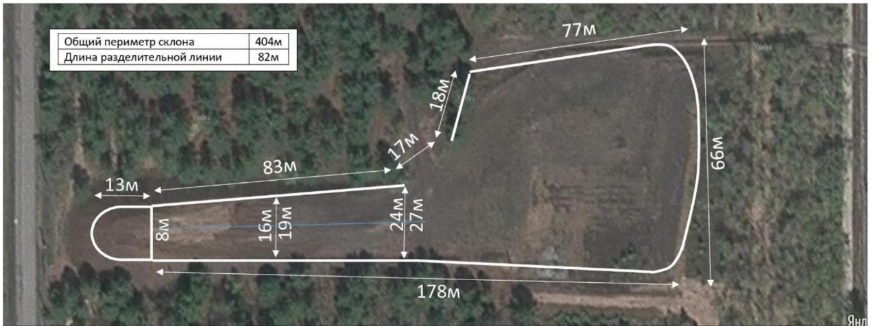
Схема тубингового склона в Экопарке