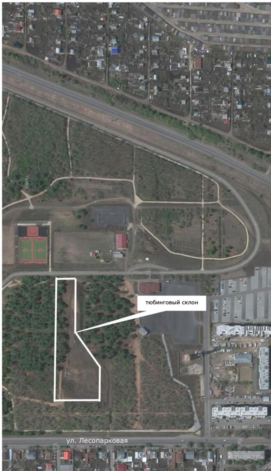
Схема тюбингового склона в Экологическом парке