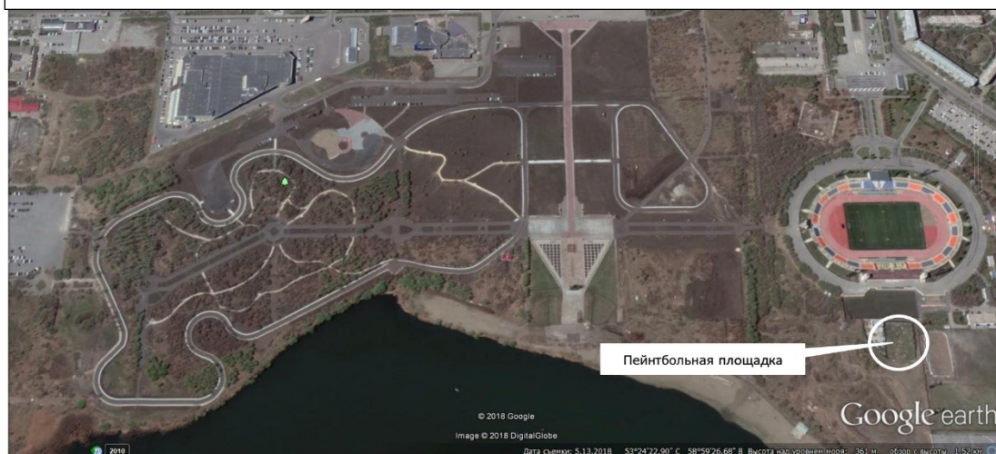
Схема размещения объекта развлечения

Главный инженер МАУ «Парки Магнитки» города Магнитогорска