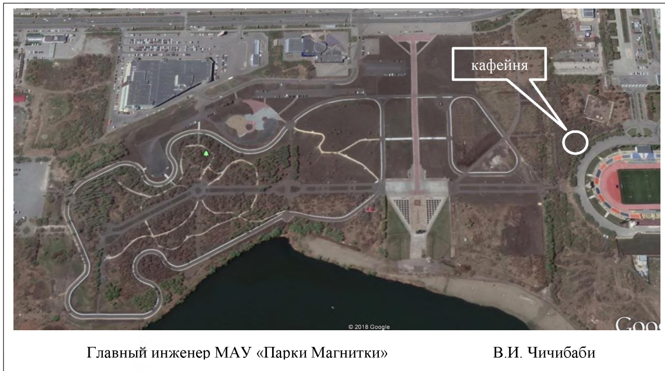
Схема размещения объекта