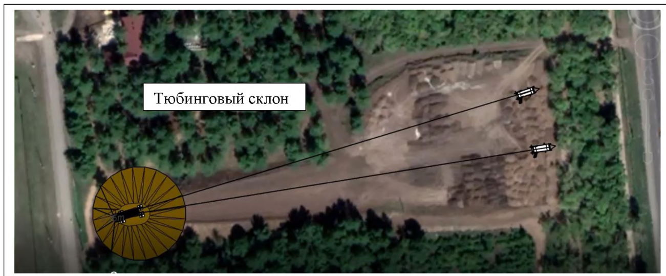
Схема размещения объекта развлечения