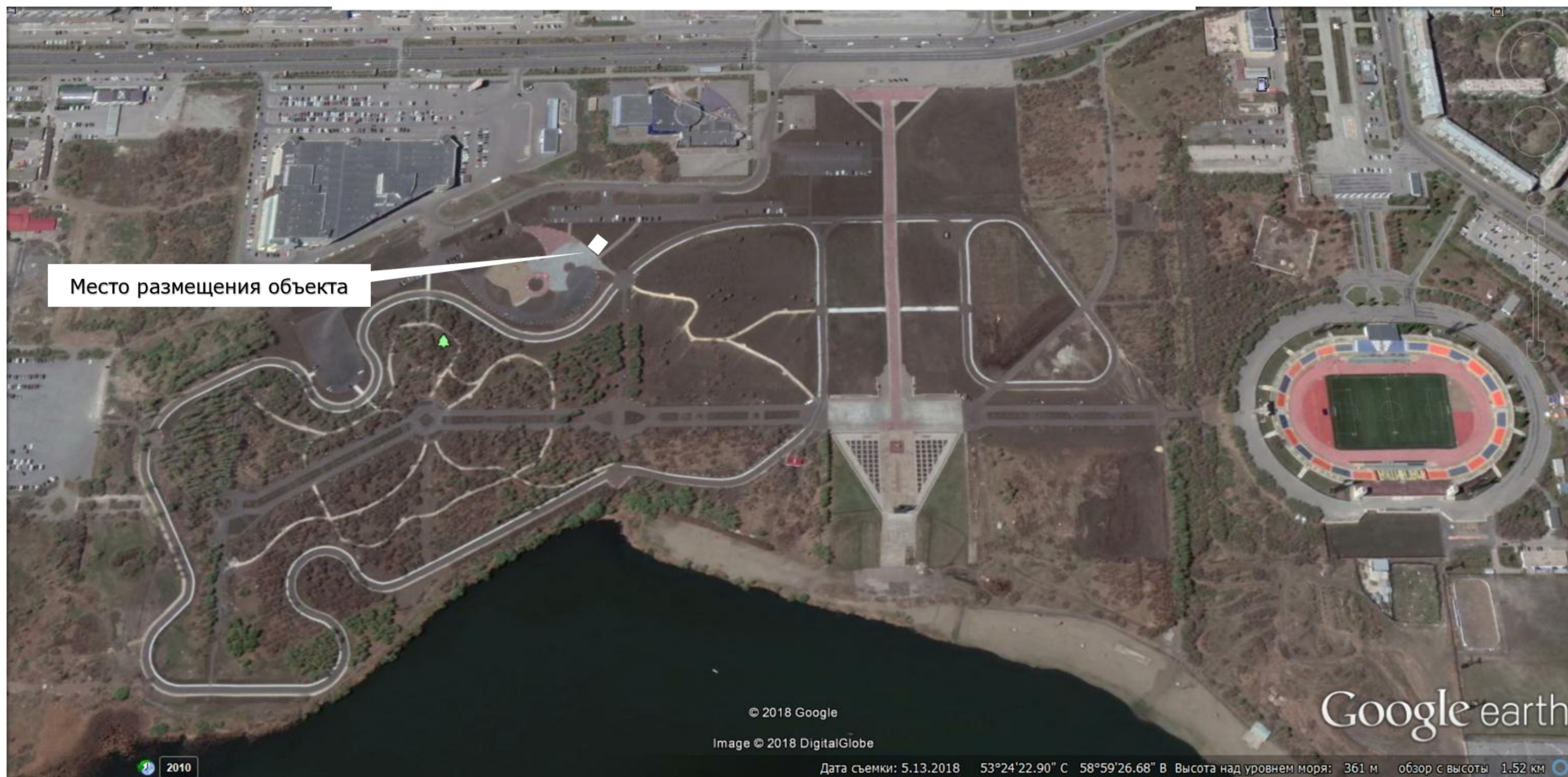
Схема размещения объекта развлечения - тир